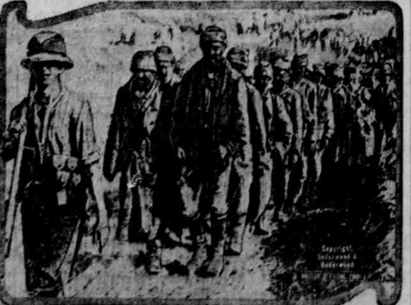
Zde jsou typy tureckých zajatců, získaných v celých tisících vítěznými vojsky generála Allenbyho.