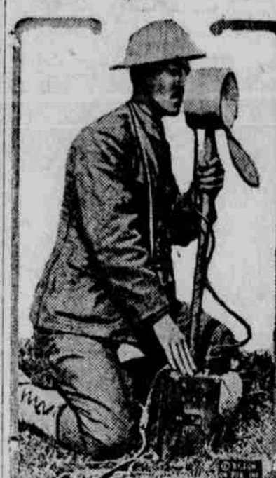
Tento kaprál poskytuje signály prostřednictvím elektrické denní signální lampy.

Jeden člověk, který řekl Němcům do očí to, co nikdo jiný před tím se neodvážil. Svět byl nakloněn vřítí jeho řeč podle její nominální ceny, netuše, že jednalo se o šalebnou hru bolševických zrádců a německých imperialistů, jež měla zakryti pravé záměry obou těchto společených rot.