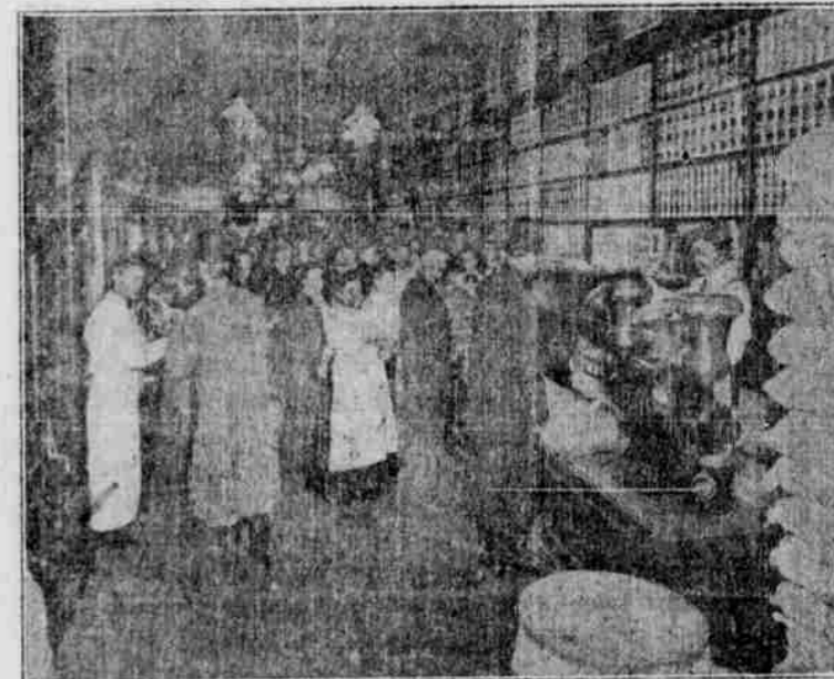
Vnitřek Basket Storu v sobotu večer, kdy obchody jsou plny odkupníků a zboží jde rychle na odbyt.