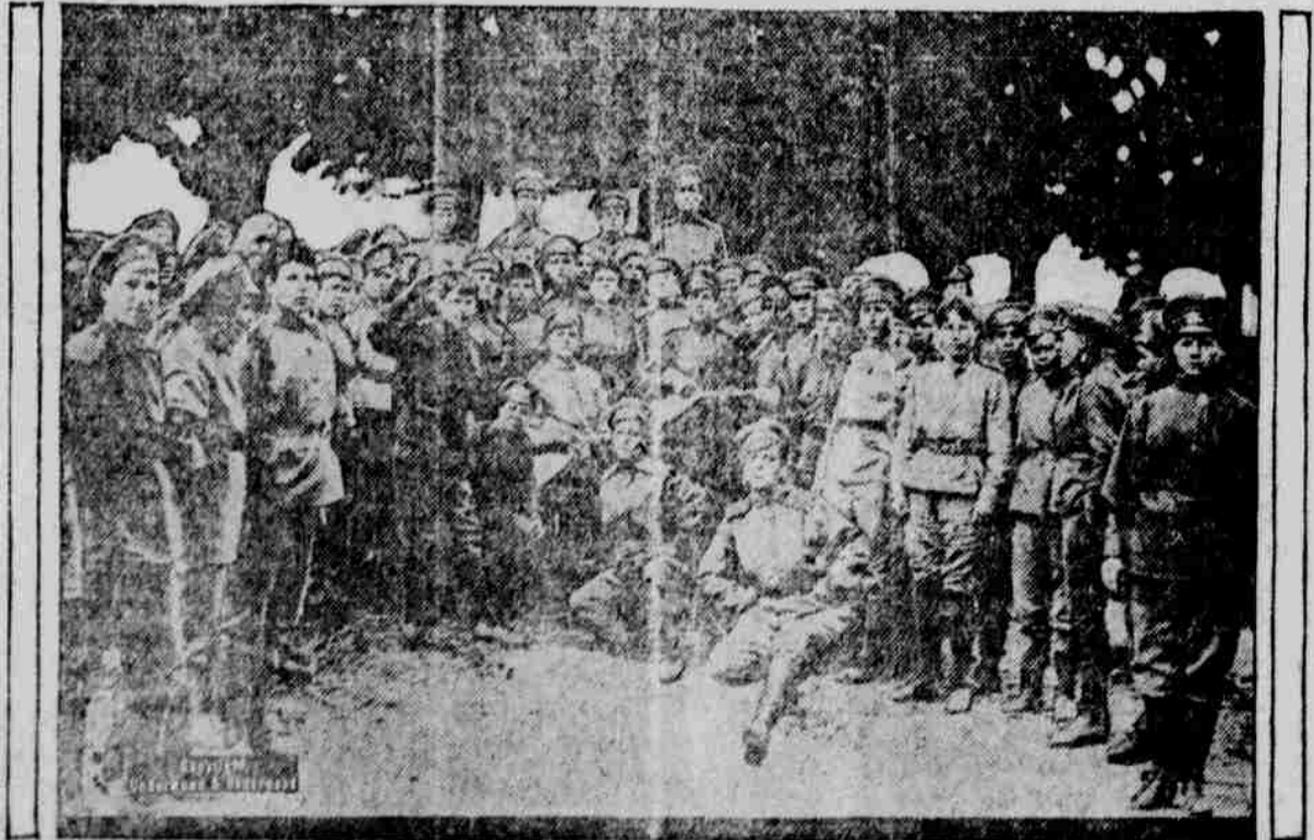
Vojenská služba je novou pro ruské ženy a následovně jejich napjetí je větší než mužů. Pro znovení tyto ženy baví se často ve svém táboře tancem. Na obrázku našem spatřujeme tuto zábavu statečných ruských žen. Všechny tyto ženy patří k batalionu smrti.