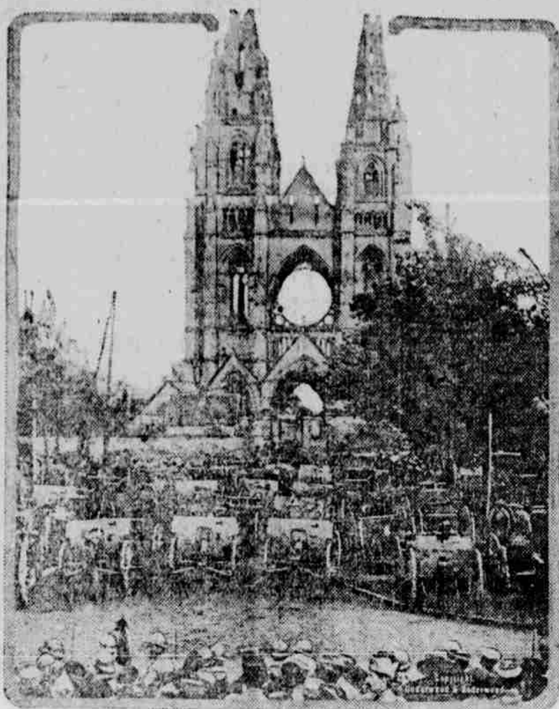
Sta německých děl získána byla francouzským vojskem v bitvě u Chemin des Dames a zde vystavena jsou na ukázkou francouzskému obyvatelstvu před proslulým starým chrámem v Soissons.

Země tato nalézá se východně od Polska, Rakouska a Bessarabie a sahá k řece Donu, pojímající značnou část území při moři Azovském. Na severu sahá až k Moskvě. Ve všech těchto distriktech Ukrajinců tvoří od 75 do 99 procent obyvatelstva. Zbytek pak jsou židé, Poláci a Velkorusové. Malorusové či Ukrajinci tvoří 20 procent obyvatelstva ruské říše.