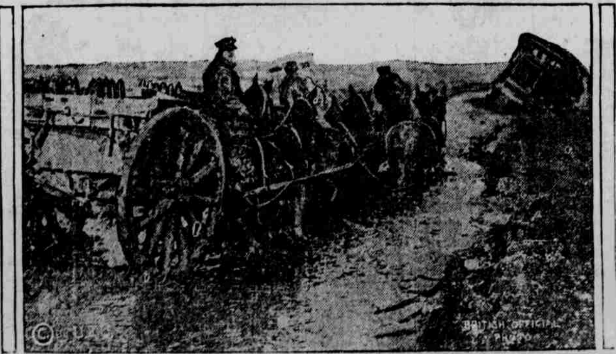
Řeky bláta v místech, kde druhy nalézaly se cesty, nemohou zastaviti velkého postupu anglického vojska ve Flandrech. Anglická úřední fotografie kazuje, jaké obtíže je nutno překonávati anglickému vojsku na postupu v tomto pruhu Belgie.