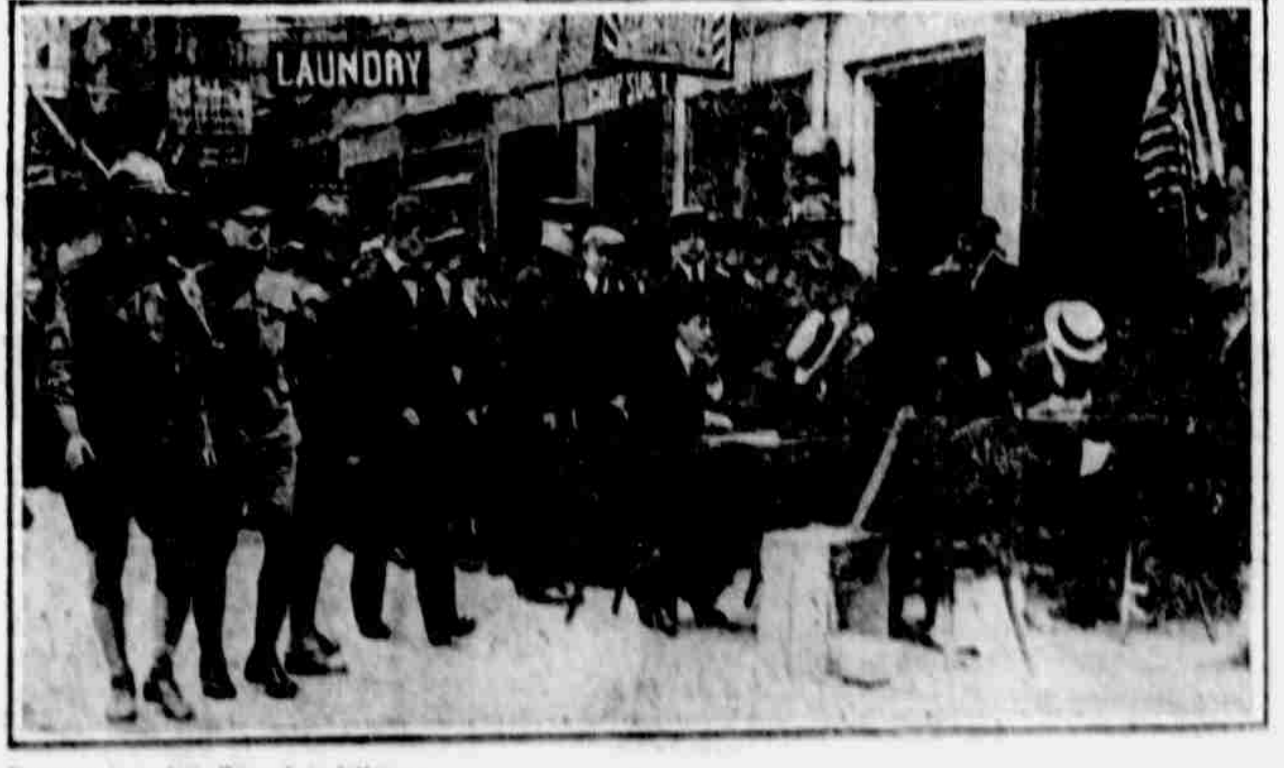
Registrování mladých mužů pro slosovací výběr dne 5. června na ulici nebylo neobyčejným sjevem. Na obrázku našem vidíme pracovati takovou registrační radu na ulici, aby předešlo se uzavru v nedostatečné velké místnosti.