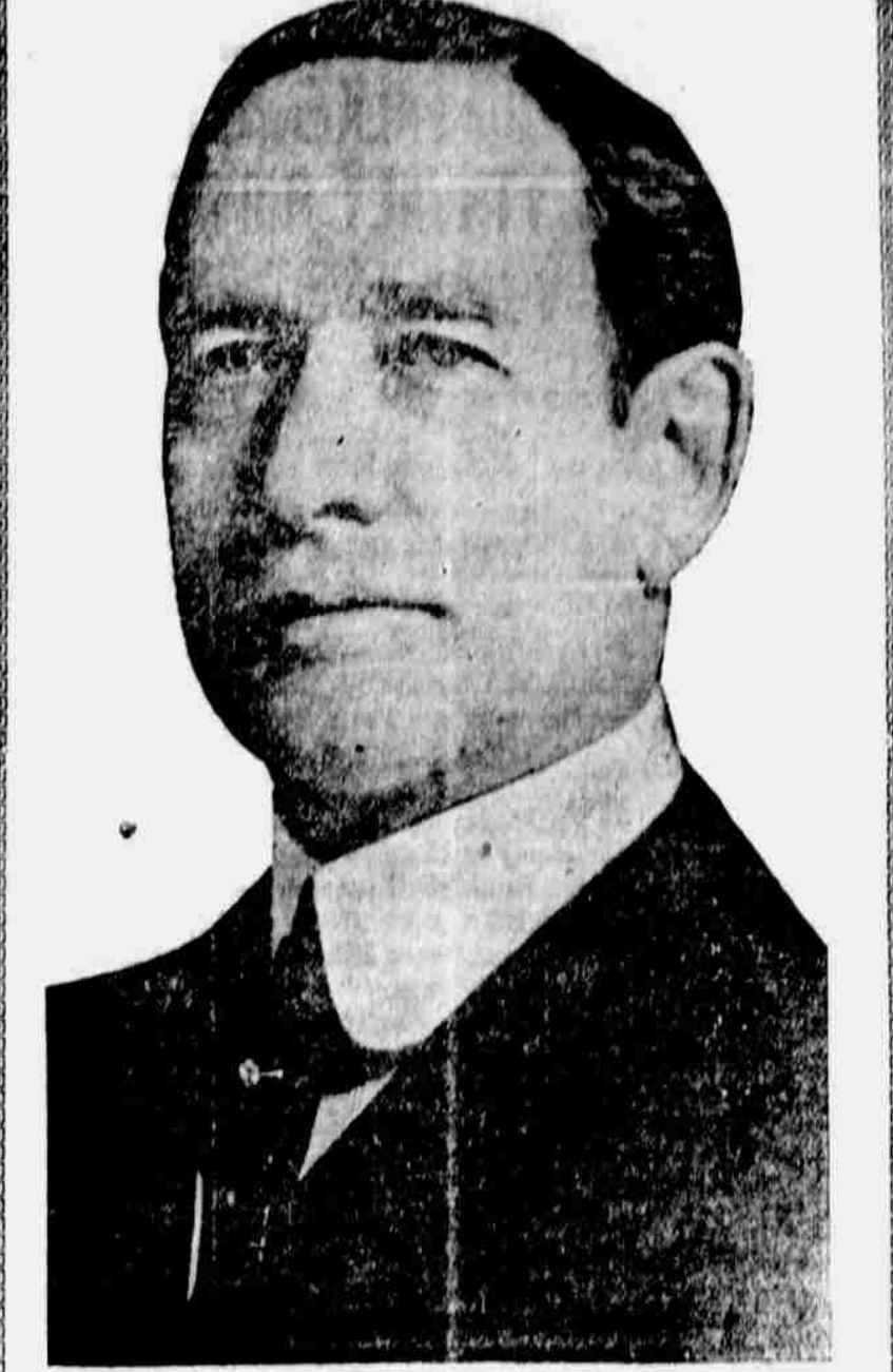
Upřímný přítel přistěhovalců. — Sám jest přistěhovalcem a jest přítelem Čechů. Hlas, jemu daný, jest hlasem pro dobrou správu a zastoupení našeho státu ve Washingtonu.