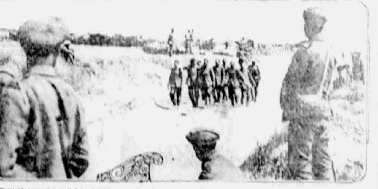
Na obrázku nálem spatřujeme oddíl zajatých německých vojáků, kteří náležejí se největší do pozadí anglických linií.