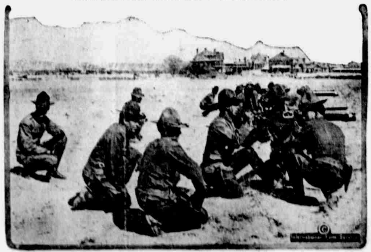
Společní kavalariisté konají cvičení se strojovými puškami v táboře Cotton, kde tisíce národních gardistů, nalézajících se nyní ve federální službě, jsou utábořeny. Tábor tento nalézá se v blízkosti El Paso.