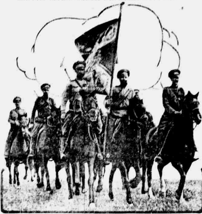
Proslulá carova osobní garda, sestávající z vybraných kozáků, podílela se na zápisu proti tatarským hordám, jež vnikly do Ruska. Na obrázku našem spatřujeme praporečnicka této gardy.

prohlídce vyzvědačských náčelníků. Byli to všichni Němci, ale s jistou znalostí francouzského jazyka. Usadili se ve Francii jako trvalí osadníci a zaměstnávali se různými pokojnými povoláními. Mnozí z nich snažili se učiniti zříditi, že jsou upřímně oddáni nové své vlasti. Ale když nastala válka, každý z nich, ale své příležitosti, snažil se poskociti Francii a přispíval k vítězství její nepříteli.