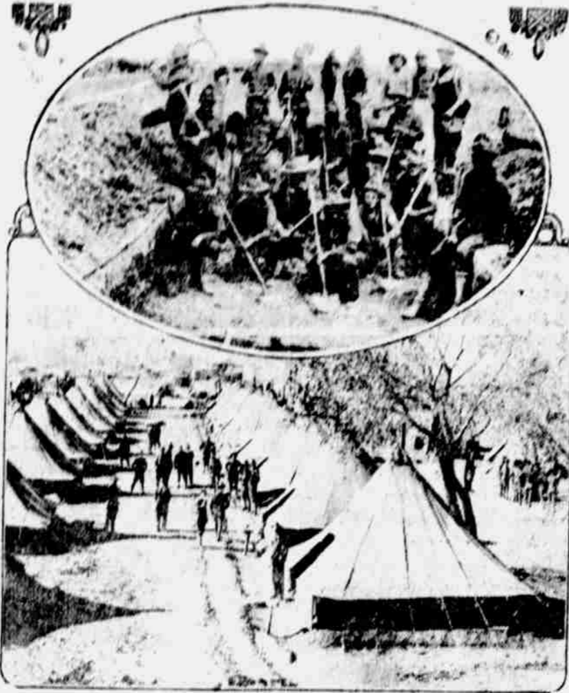
Tábor spolčového vojska v El Paso a vojáci, kopající zákopy, jako opatření proti možnému útoku Mexikánců proti Spojeným Státům.