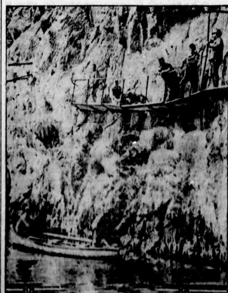
Rakouská vojska budují stez ku na boku hory v Tyrolsku, aby získali úcovou šíu k útoku na italská vojska.

unuděné: "Co chtějí říkat? Nedovodou se bavít na fákou solidnější fazónu!"