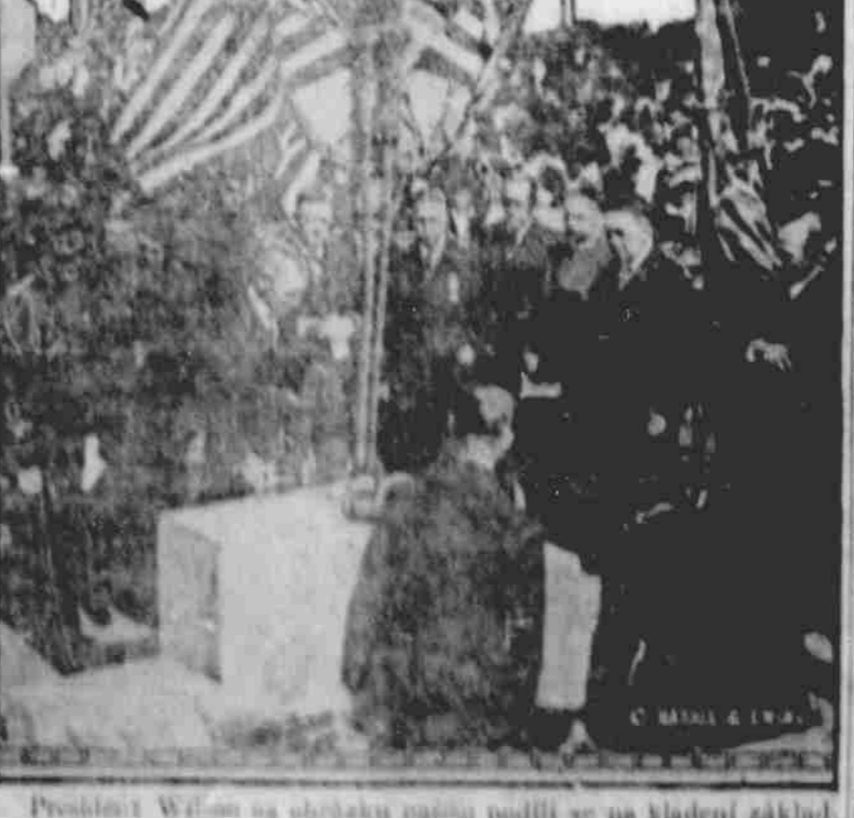
President Woodrow Wilson na obřadu kladení základního kamene novému památníku amphitheatre, který zbudován bude na Arlingtonském národním hřbitově k uctění památky hrdinů občanské války.