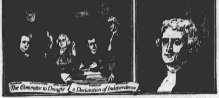
THOMAS JEFFERSON "otec prohlášení neovislosti"