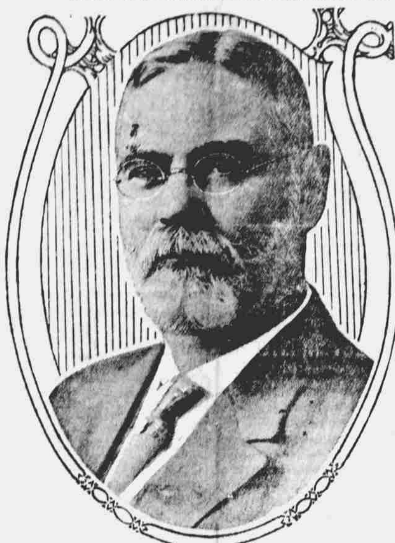
Kongresník James R. Mann, vůdce menšiny ve sněmovně poslanců, jest odporčován za republikánského kandidáta prezidentství v r. 1916.

pozůstává z 500 mužů a mimo to přivezl 61 britských zajatců. Ostatní vyloďil na různých místech jiho-amerického pobřeží. Hodnota zničených lodí a jich nákladů se odhaduje na $7,000,000.