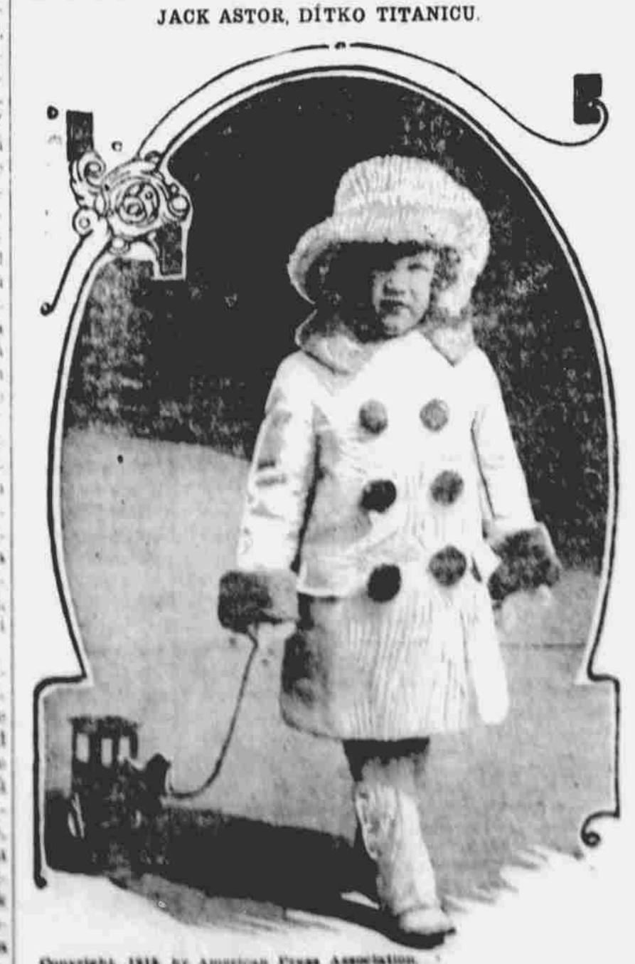
John Jacob Astor, šli Jack, narodil se, když jeho matka, pí Madeline Force Astorová, byla za chráněna z tonoucího Titanicu, kde jeho otec přišel o život. Nyní jest dva a půl roku star.