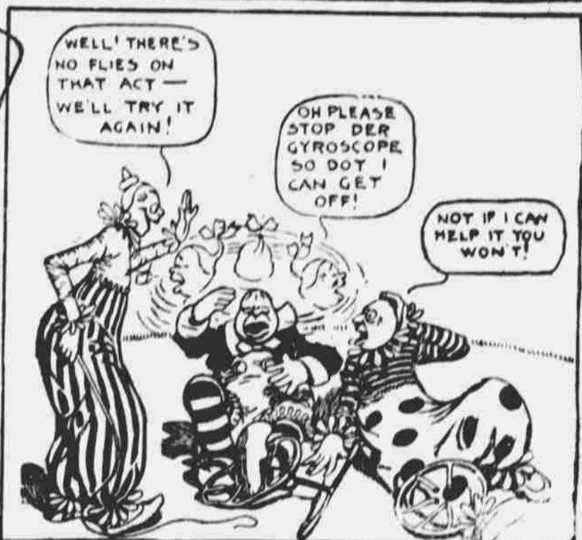
SIMONA SIMPLE A PRVNÍ LEKCE V ŠAŠKOVSTVÍ.