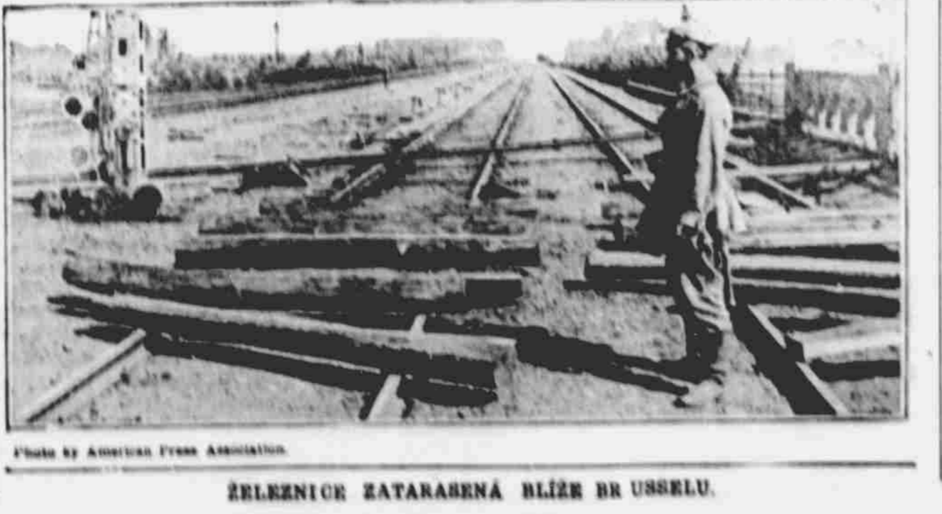
REKONSTRUKCE ZATARAŠENÁ BLÍŽ BR USSERLU.