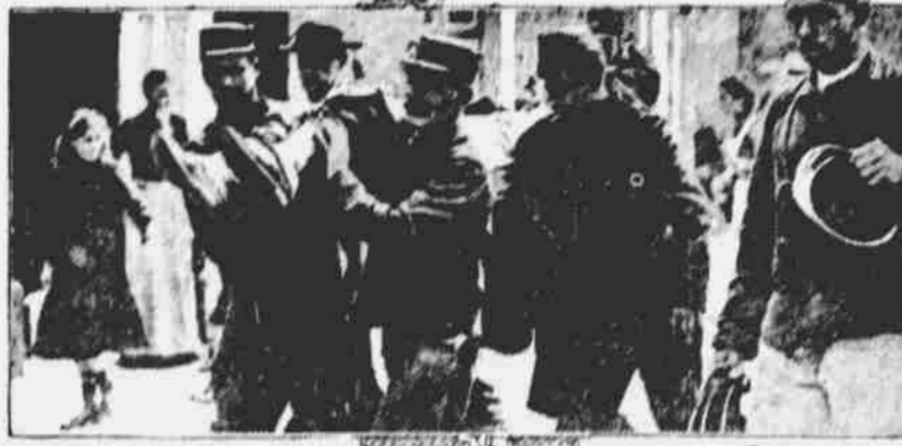
RANĚNÝ BELGICKÝ VOJÁK.