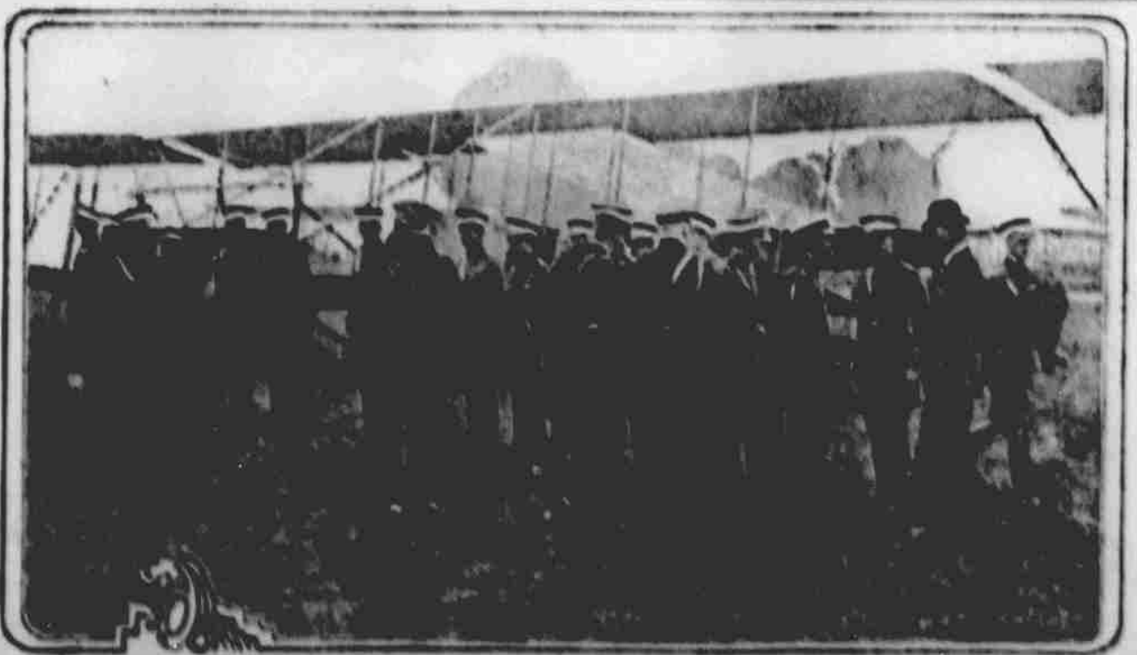
KRAL JIŘI ANGLICKÝ NA PROHLÍDKĚ AVIATIKŮ.

Elektrická bouře, provázená silným větrem a krátkým, hojným výsk. lijákem, přibrala se náhle na město New York a okolí minulý úterý pozdě odpoledne. Tři osoby byly zabity a dvacet poraněno bleskem, který na mnohých místech uhodil, a při srážení se klenby v novém tuncu pro podzemní dráhu na patnáct dílků.