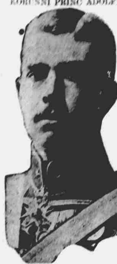
Nastoupí na švédský trůn.

skutečnil v New Yorku neb uvedl do proudu: "Pan Riis vykonal práci, která získala malé parky pro předlé- ný místa ve městě. On pracoval úsilovně o zbudování většího po- četú škol. Žla, která postavil na pramen, objevil ve svém zpravo- dačském povolání. On dovedl psati, aby pomohl ardit lidí svým zpravami o útisku, bídě a bez- nadejnosti. On donutil lhotečné- městské úřadníky provesti refor- my, které navrhoval neb schvalo- val."