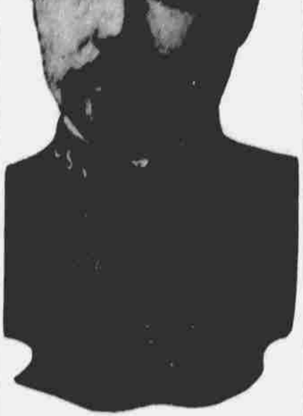
FREDERICK FUNSTON. Brigádní generál, jenž převzal vrchní velení vojska shromážděného v Texas City, Tex.

Jiskry z chatrného komína v jednom obydlí v Clatonii zavily požár v 7 hodin ve čtvrtek večer, který ve čtyřech hodinách, kdy marně usilováno o jeho omezení, natopil za $20,000 škody. Ztráta jest z větší části kryta pojištěním. Bylo již 11 hodin, když konečně, díky úsilí dobrovolných hasičů, požár přiveden byl pod kontrolu.