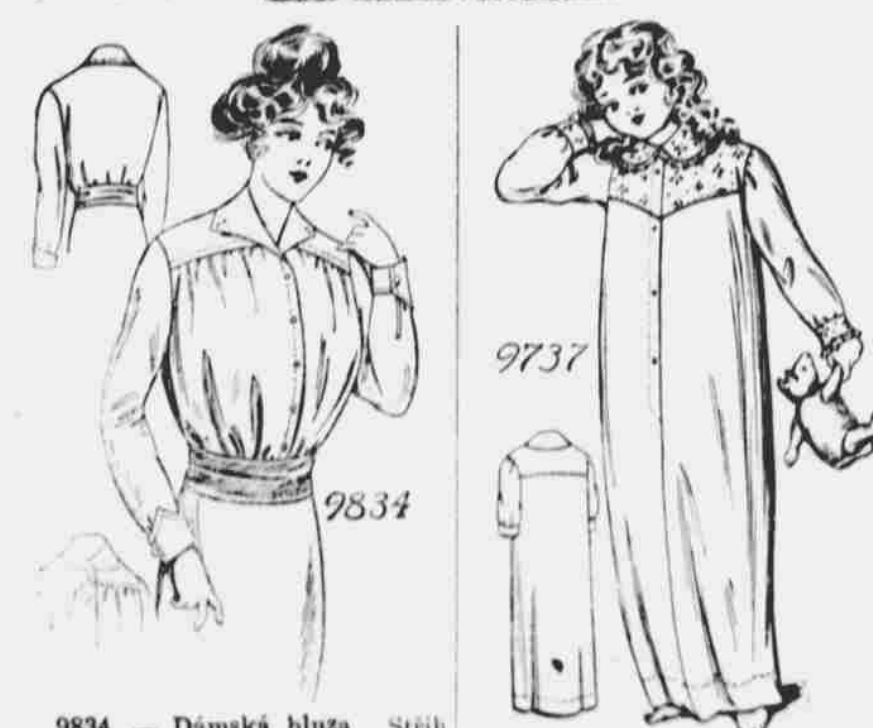
9834. — Dámská blůza. Strih v sedmi velikostech: 32, 34, 36, 38, 40, 42 a 44 palců přes prsa. Vyžaduje 2 1/4 yardů 44-palcové látky na velikost 36 palců.