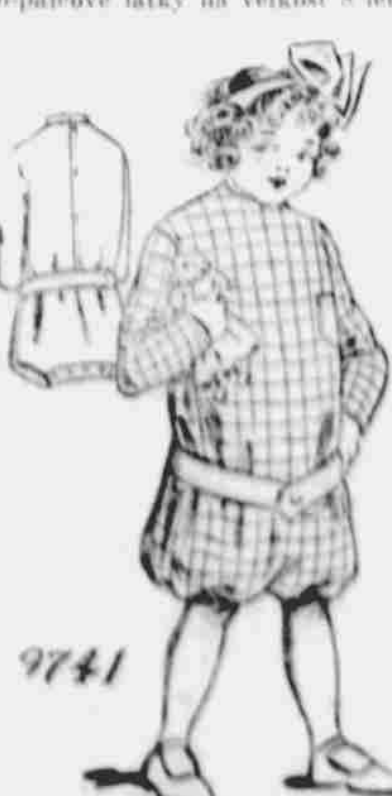
9741. — Dívčí 'rompers'. Strih ve čtyřech velikostech: 1, 2 a 3 roky. Jest zapotřebí 2 1/4 yardů 36-palcové látky pro velikost na 3 roky.