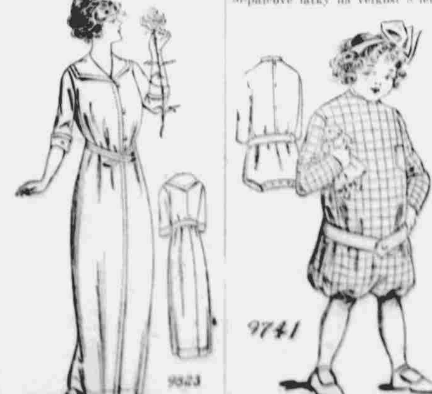
9833. — Dámský šat pro domov. Strih ve třech velikostech. Pro malé, prostřední a velké. Vyžaduje 5 1/2 yardů 44-palcové látky pro prostřední velikost.