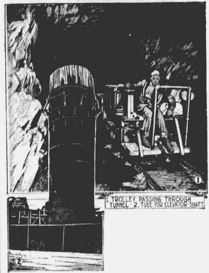
Nový vodovod z pohoří Catskill, na jehož zbudování bylo vynaloženo $152,000,000, vniká do města New Yorku ve hloubce více než 400 stop, při 149. ulici a St. Nicholas Place. Obrázek tento znázorňuje elektrickou dráhu procházející tunelem a šachtu pro elevátor.