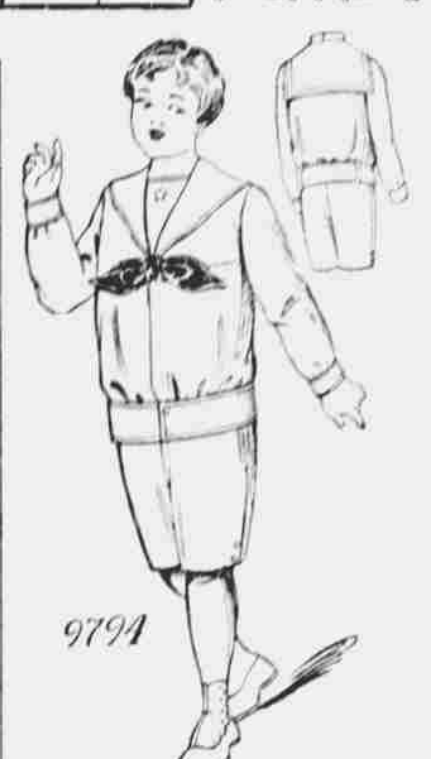
9794. Oblek pro hochy. Strihy ve 4 velikostech: 4, 6, 8 a 10 let. Jest třeba 3 1/4 yardu 44-palcové látky pro velikost 8 let.