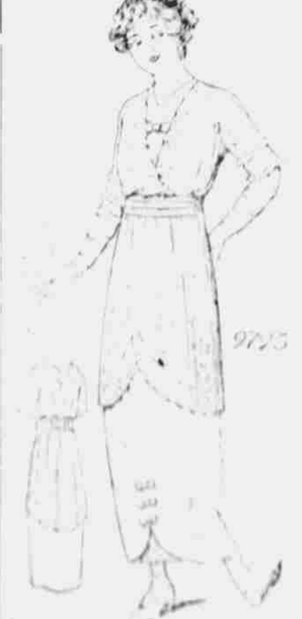
9795. — Oblek pro slečny a paní malé postavy. Strihy ve 4 velikostech: 14, 16, 17 a 18 let. Jest třeba 5 yardů 44-palcové látky pro velikost 17 let.

Upozorňujeme naše odběratele, by při objednávce vzorků strhů cromptenuli udati mimo naznačeného čísla, ještě míru aneb stáří.