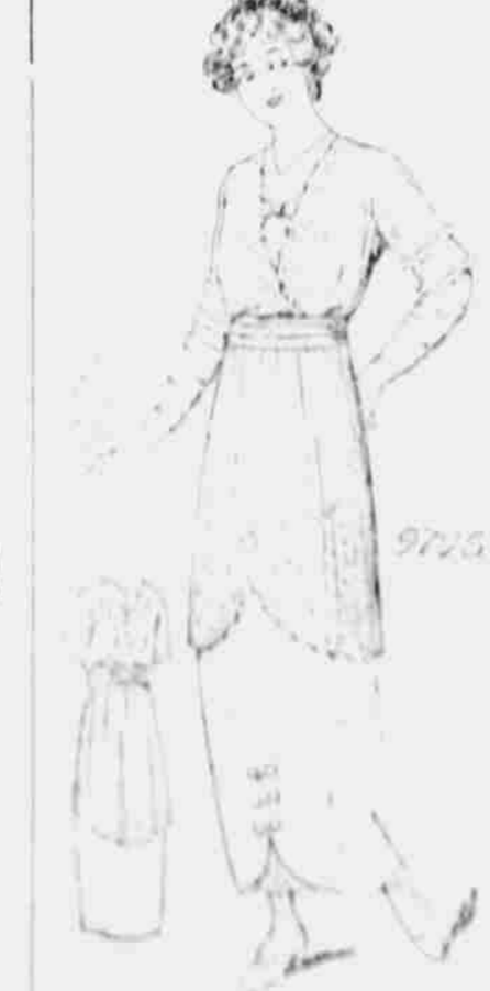
9796. — Oblek pro slečny a velmi malé postavy. Strihy ve 4 velikostech: 11, 13, 15 a 18 let. Jest třeba 5 1/2 yardu 44-palcové látky pro velikost 11 let. Každý, kdo sobě předplatí na některý z našich listů, obdrží jeden módní vzorek-štíhů úplně zdarma. Další vzorky za 10c jeden.

Upozorňujeme naše odběratele, by při objednávce vzorků štíhů vzpomněli udáti mimo naručeného čísla, jestli míru aneb stáří.