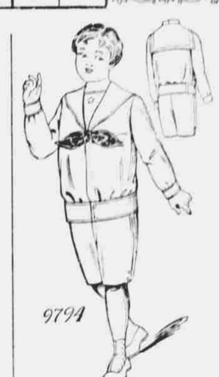
9794. Oblek pro hochy. Strihy ve 4 velikostech: 4, 6, 8 a 10 let. Jest třeba 3 1/4 yardu 44-palcové látky pro velikost 8 let.