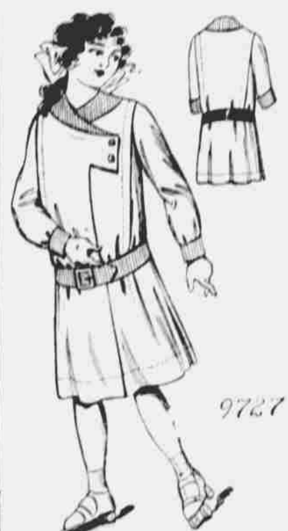
9727. — Oblek z jednoho kusu pro dívky. Střihy ve 4 velikostech: 6, 8, 10 a 12 let. Jest třeba 4 yardů 40-paleové látky pro 12 let.