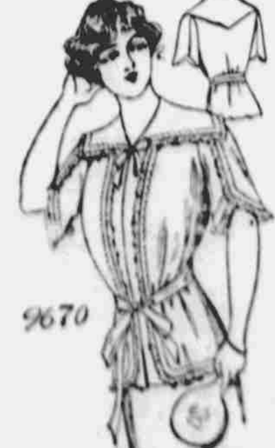
9670. — Blusa pro dámy. Střihy ve 3 velikostech: Malé střední a velké. Jest třeba 3 1/2 yardů 36-paleové látky pro střední velikost.