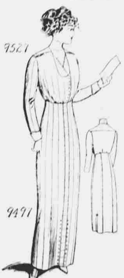
9527 — 9497. Kostým pro dámy. Živůtek č. 9527 v 5 velikostech: 34, 36, 38, 40 a 42 paleů přes prsa. Sukně č. 9497 v 5 velikostech: 22, 24, 26, 28 a 30 v pasu. Jest třeba 6 yardů 44-paleové látky pro velikost 36 paleů na celý oblek. Každý střih po 10 centech.