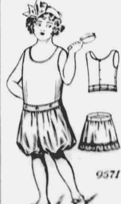
9571. — Spodní živůtek, kalhotky a spodnička pro dívky. — Střihy v 6 velikostech: 2, 4, 6, 8, 10 a 12 let. Pro stáří 8 let jest třeba 1 1/2 yardu na spodničku a 1 1/2 yardu pro kalhotky a 1 yardu na živůtek 36-paleové látky.

Každý, kdo sobě předplati na některý z našich listů, obdrží jeden měsíční vzorokatřítí úplné zdarma. Další vzorky za 10c jeden.