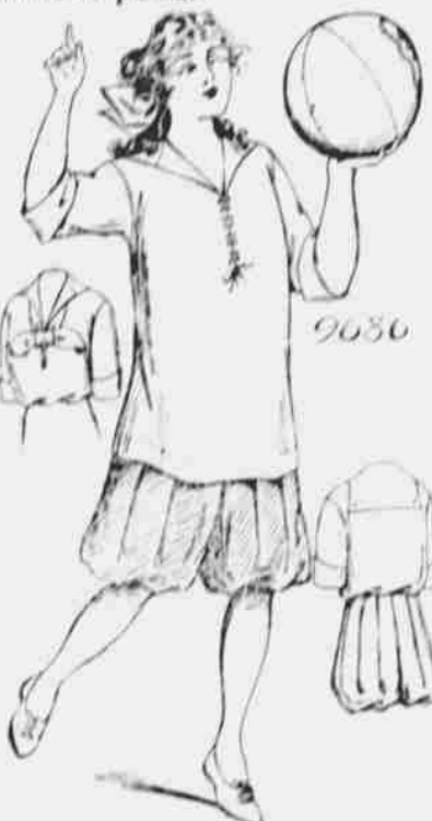
9686. Divčí oblek pro hry. Střihy ve čtyřech velikostech: 8, 10, 12 a 14 let. Jest třeba 3 a půl yardů 44-palcové látky pro velikost 8 roků.