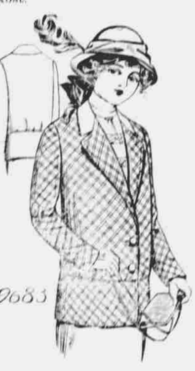
9683. Kabátek vzoru Balkán pro slečny a paní malé postavy. Střihy ve 4 velikostech: 14, 16, 17 a 18 let. Jest třeba tři yardy 44-palcové látky pro 16 let.

dobře si všiml, jakoby v jejím rudém svitu tam na mýtině nějaké přílby a kyrsy se blyskly. "Zrada!" zazněl divý výkřik, a jemu v zápětí následoval výstřel arkebuzy.