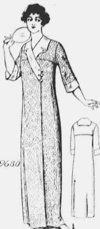
9680. Kimono pro dámy. Střihy ve velikostech: malé, střední a velké. Jest třeba pět a půl yardů 44-palcové látky pro střední velikost.