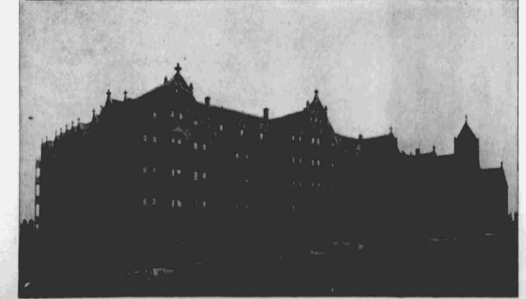
Nemo-nice sv. Josefa v Omaze.

usilují sarnáči následující výhody: Hobatou půdu, krásnou dobrou vodu, státní poště, 12 měsíců vzdásta, třešňové stromy, dobré trávy, blízkost moře, úrodná půda, elektrické světlo, telefon, záložní kucha, vyškolený, křepelčí, uspravedl jené školy. Úplně vybavení neb sponá velkou širokou zásobou, kataná, rhumatismus, nemoci kardinálních, nemoci ženských atd. Ceny poměrně nízké než na východě, a jistý přírůstek nejméně 50% po ukončení příštích let. V Ca lifornii budete mít krásný život při vyniklé obsluhě. Přijte a podívejte se sami. Laciné jízdné do 13 dnů a pak po celý rok první a třetí třída v městě. V. PULEC, 306 Forum Building, cor. 3. a 4. K. SACRAMENTO, CALIFORNIA.