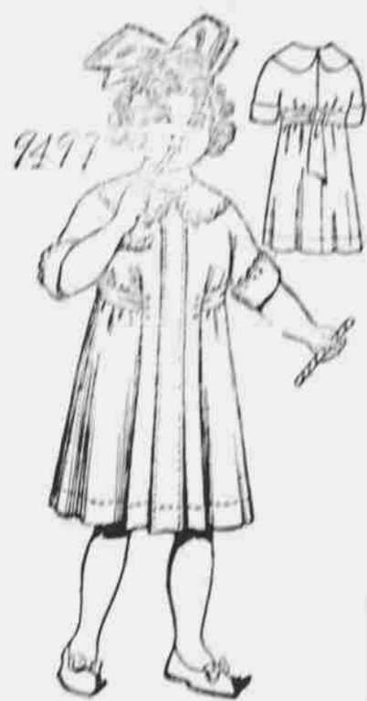
9499. — Empirový oblek pro děvčata. — Střihy ve 4 velikostech: 2, 4, 6 a 8 let. Jest třeba 3 yardy 44-palcové látky pro velikost 8 let.