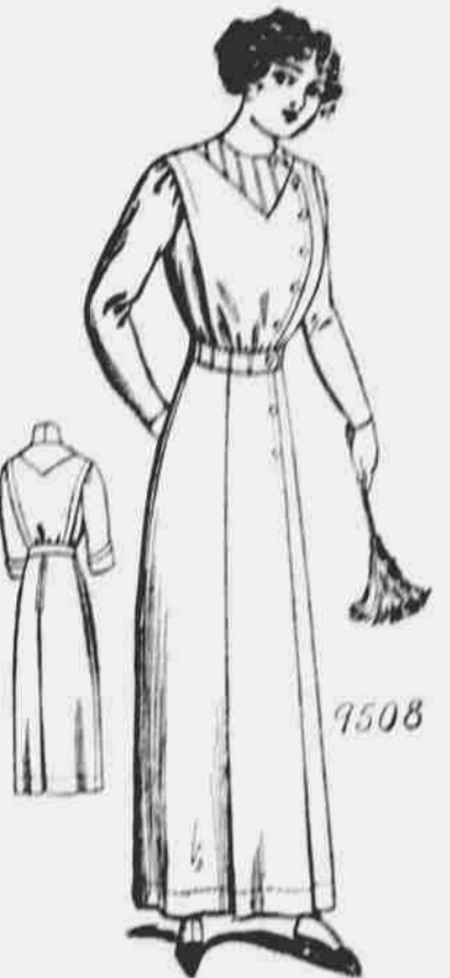
9508. — Domácí oblek pro dámy. — Střihy v 6 velikostech: 32, 34, 36, 38, 40 a 42 palců. Jest třeba 7 yardů 36-palcové látky pro velikost 36 palců.