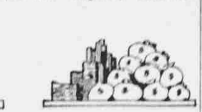
Cena hospodářských výrobků celého světa. Cena hospodářských výrobků ve Spojených Státech.

než my, ale oběho dohromady nedobude se nikdy na světě tolik jako ve Spojených Státech. Tak zv. odhad národního jmění dával Spojeným Státům roku 1870 30,000 mil. majetku, roku 1900