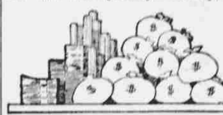
Cena hospodářských výrobků celého světa. Cena hospodářských výrobků ve Spojených Státech.

podněbí, ale i v lidu panují velké rozdíly a že tento rozkvět není všude stejným a že nepřipadá na každou část Spojených Států stejný díl z tohoto zisku a pokroku. Jak velké jsou tyto rozdíly,