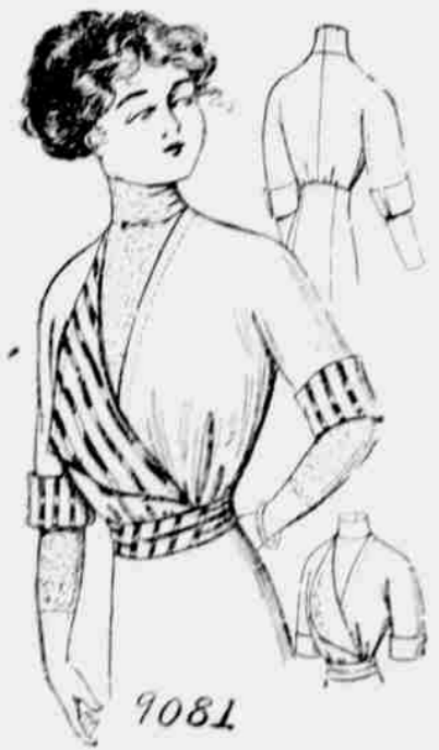
9081. — Damský živůtek. — Velikosti: 34, 36, 38, 40 a 42 palce v prsou. Jest třeba 2½ yardu 44-palcové látky pro velikost 36-palcovou.