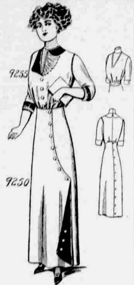
9255—9250. — Damský oblek. Živůtek 9255 velikosti: 34, 36, 38, 40 a 42 palce v prsou. Sukně 9250 velikosti: 22, 24, 26, 28 a 30 palců v pásu. Jest třeba 8 1/2 yardu 27-palcové látky na celý oblek pro prostřední velikost. Toto vyobrazení vyžaduje dvou zvláštních muštrů, jež budou zasílány poštou každému, kdo zašle 10 centů za každý.