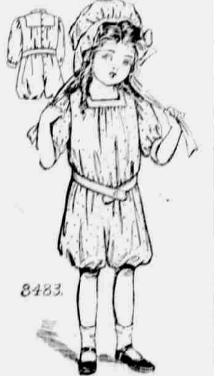
8483. — "Rompers" pro dívky. Velikosti pro 2, 4, 6 a 8leté. Jest třeba 2 1/2 yardu 36-palcové látky pro 4-leté.