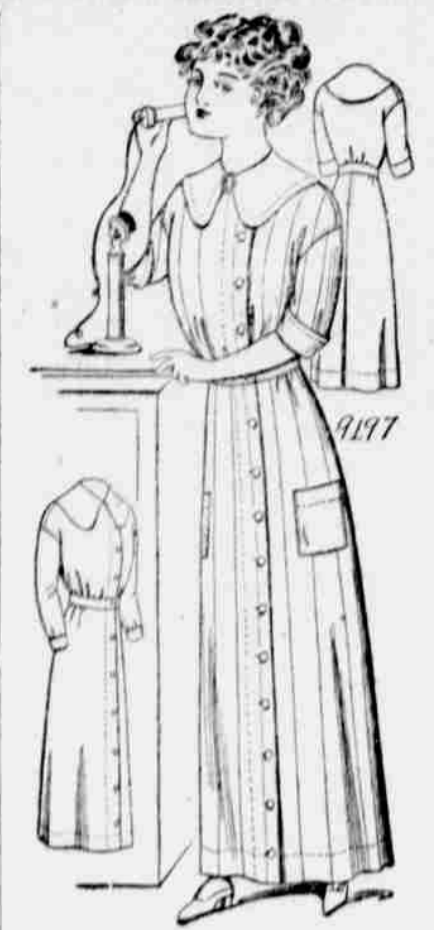
9197. — Damské domácí šaty. Velikosti: 34, 36, 38, 40 a 42 palce v prsou. Jest třeba 5 yardů 44-palcové látky pro velikost 36-palcovou.