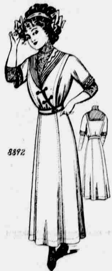
8892. — Šaty pro dívky. Velkosti po 14, 15, 16 a 18leté. Jest třeba 4 1/2 yardu 44-palcové látky pro 16letou a 1 1/2 yardu 27-palcové látky na náprsníček.

Každý, kdo sobě předplatí na jeden módní vzorek-šití úplné