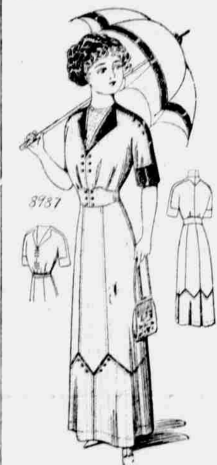
8987. — Damské šaty. Velkosti: 34, 36, 38, 40 a 42 palce v prsou. Jest třeba 8 yardů 27-palcové látky pro velikost 36-palcovou.

některý z našich listů, obdrží je zdarma. Další vzorky za 10c jeden.