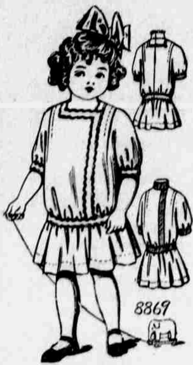
8869. — Dětské šatečky. Velkosti pro 2, 4, 6 a 8leté. Jest třeba 3/4 yardu 36palcové látky pro 6leté.