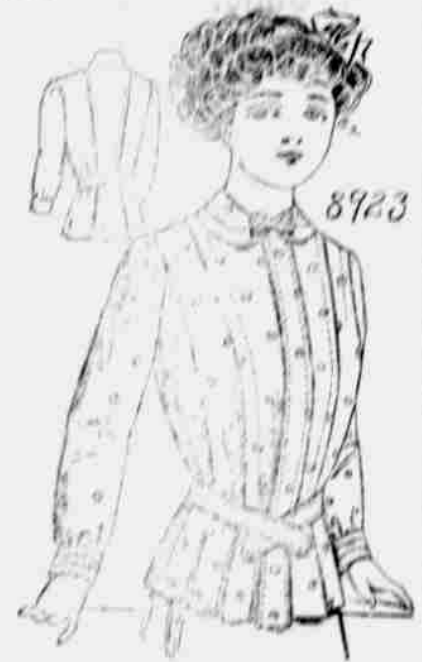
8923. Dámské sáčko. Velikost: 32, 34, 36, 38, 40 a 42 palců přes prsa. Je třeba 4 1/2 yardy 27-palc. látky pro 36 palců velikost.