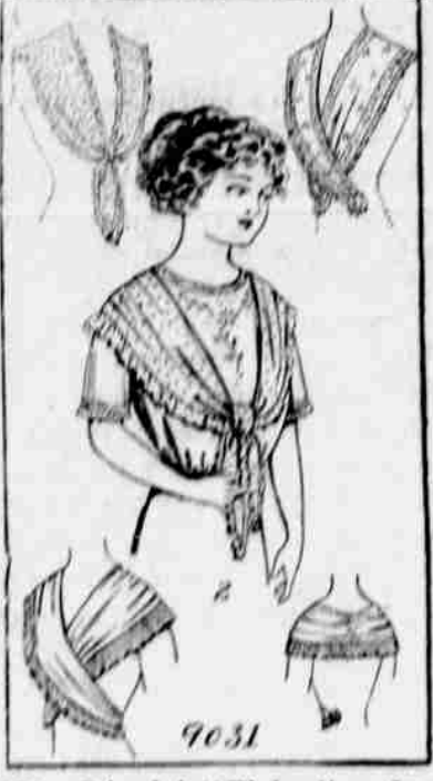
9031. Dámský "Fichus" ve dvou stylech.

Časopis "New York America" dotazoval se slavného vynálezce telegrafie bez drátu pana Marconiho o myšlence dorozumívání se s obyvateli Marsu, je-li jich tam totiž. Italský vynálezce odpověděl, že již v deseti letech budeme mocti přímou a s naprostou jistotou poslati zprávy Marsanům světovým proctorem. Může-li být anglickému králi playboisem se do Indie, zaslán bezdrátový telegram z Anglie do Indického moře, může také dojít k dorozumívání s Marsem. Jeho vzdálenost 7 milionů zeměpisných mil není taková, aby byla překážkou. "Jsem přesvědčen," — pravil Marconi — "že Mars je obydlen rozumnými bytostmi, které porozumí našim znamením. Jen záští! O to by se měla postarat Amerika." Na otázku spravodajovu, zabývali-li se Marconi s tím přípravami k řešení této otázky a převzali-li by případně provedení věci, kdyby ji financovala americká vláda, odpověděl Marconi kladně.