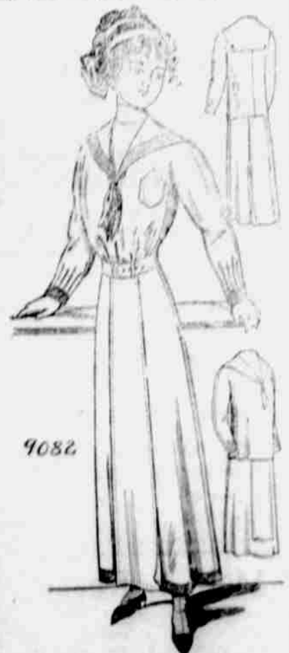
9082. Blůzička pro dívky nebo malé ženy. Velikost pro 14, 15, 16, 17 a 18leté. Je třeba 4 3/4 yardu 44-palc. látky pro 14leté.

Každý, kdo sobě předplatí na některý z našich listů, obdrží jeden módní vzorek — stříh úplně zdarma. Další vzorky za 10c jeden.