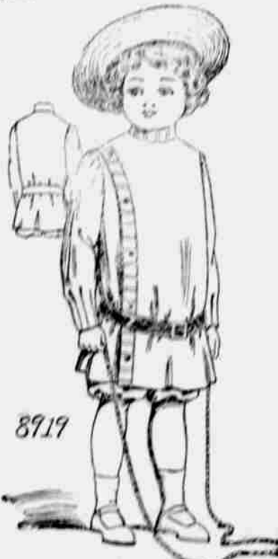
8919. Šatečky pro chlapce. Velikost pro 2, 4, 6leté. Je třeba 2 3/4 yardu 44-palc. látky pro 4leté.

Jedna velikost: střední. Je třeba 1 1/4 yardu 45-palc. látky pro No. 1, s krajkovou obrubou 4 yd. dlouhou nebo 3 yardy vložky. Pro No. 2, je třeba 1 1/2 yardu 36-palc. látky s 9 3/4 yardu karnýru.