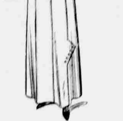
9001—8945. Dámský kostým. Živůtek 9001, rozměry: 32, 34, 36, 38, 40 a 42 paleč přes prsa. Sukně 8945, rozměry: 22, 24, 26, 28, 30 paleč v pasu.

Jest třeba 6¼ yardu 44-palc. látky pro střední velikost.