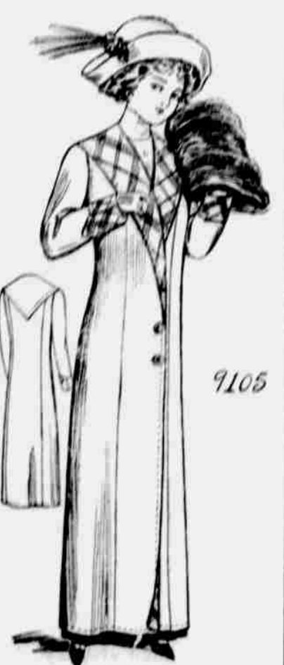
9105. Dámský dlouhý kabát. Velikost: 34, 36, 38, 40 a 44 paleč přes prsa. Jest třeba 6¼ yardu 54-palc. látky pro 36 paleč velikost.

Tento obrázek vyžaduje dva zvláštní vzorky, které budou posílány každému za doplatek 10 ctů, za každý vzorek, v penězích nebo ve známkách.