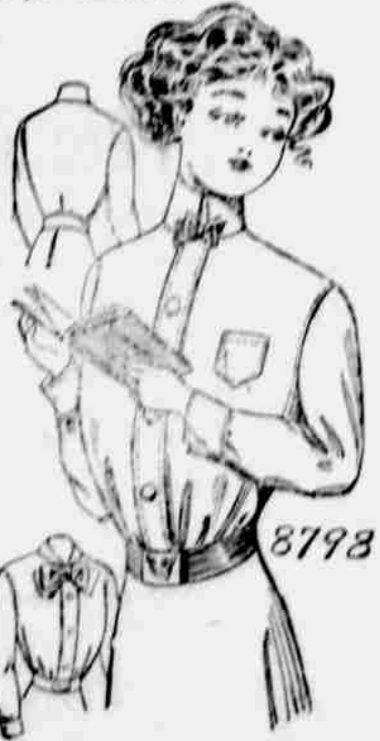
8798. Dámská jupička. (Shirt Waist) Velikost: 32, 34, 36, 38, 40 a 42 paleč přes prsa. Jest třeba 2¾ yardu 27-palc. látky pro 36 paleč velikost.