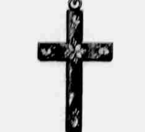
Platýrované $1.25. Zlaté od $2.75 výše.