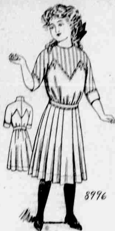
8996. Šaty pro dívky. Velikost: pro 6, 8, 10, 12-leté. Jest třeba 3¼ yardu 27-palc. látky pro osmileté.