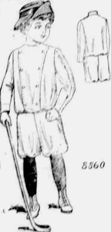
8860. Oblek pro chlapce. Velikost: pro 4, 6, 8, 10-leté. Jest třeba 3½ yardu 36-palc. látky pro šestileté.