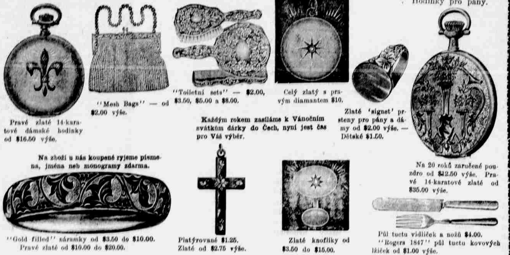
Pravé zlaté 14-karátové dámské hodinky od $16.50 výše.

Z Čech importované pravé granátové zboží jako: Špendlíky, brože, náramky ve velkém výběru. Zajděte v čas k nám a naše zásoby solidního zboží si prohlédněte.