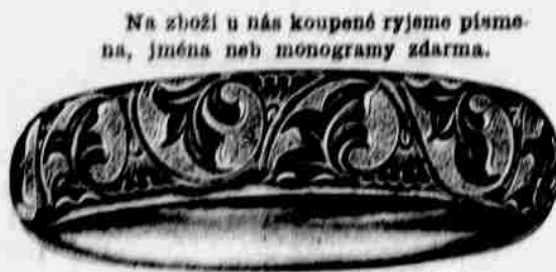
"Gold filled" náramky od $3.50 do $10.00. Pravé zlaté od $10.00 do $20.00.