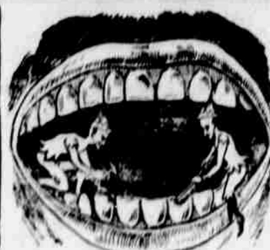
Tak často slycháme

Postroje z druhé ruky: Jedno + koňské od $2.50 do $5.00; párové + od $10.00 do $25.00. 38-4m