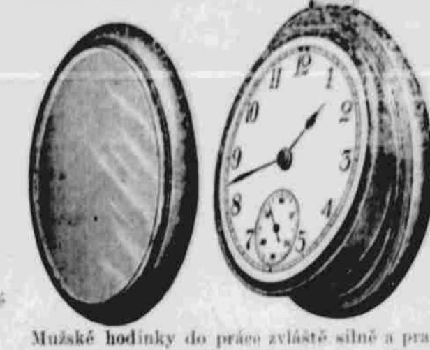
Mužské hodinky do práce zvláště silné a práchu vzdorné, pláštík (nickel-silver) s Elgin neb Waltham strojkem zaručené ..... $5.50