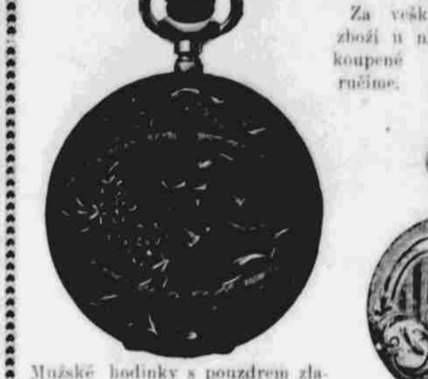
Mužské hodinky s pouzdem zlatem plněným a na 20 roků zaručené s Elgin strojkem ..... $13.25