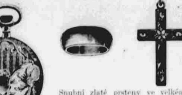
Na předměty u nás koupené vkusně vygravírujeme Vaše plná jména úplně zdarma.