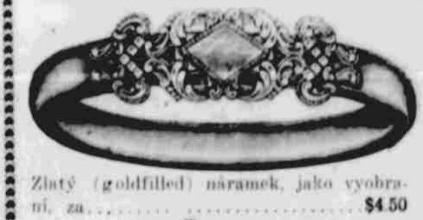
Zlatý (goldfilled) náramek, jako vyobrazení, za ..... $4.50