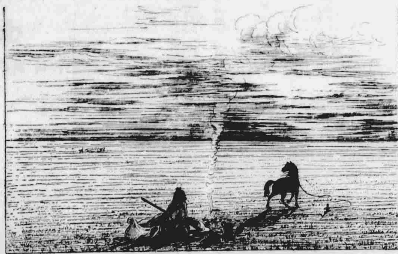
VLKY OHROŽENÝ LOVEC ZA NOCI V ÚDOLÍ PLATTE. (Gallie.)

Dlužno jen litovati, že v některých záležitostech se nemohou posle našeho hesla srovnat. Nemůžeme, bych rozhodoval, kde chyba jest, neboť osnova všeho jednání běře svůj počátek na sjezdu, protož by bratři zástupci sami mezi sebou měli rozhodnout, na které straně jest právo. Dále bych radil, by etná redakce vedla přísnější dohled na podobné dopisy, jakým byl ten, který jsem nucen omluvit a neměl-li pisatel potřebné důkazy a chtěl-li by působit pohoršení, vysvětlit mu nemožnost tak škodlivého jednání. K poslednímu máje na mysli ještě dopisování mezi spolky při sbírce na Úst. Matiči Školskou v Čechách, vzdávám srdečný pozdrav jako opětovně uvaží na jejich věrné příspěvy při zásluhách. Též tímto omlouvám ty, kteří se v onen čas nemohli účastnit, některé spolky nás již v podobné akci předšly a některé podly různými podporami pokladni vyčerpanou. Doufám, že při čilnější agitaci v příhodnější době budeme mezi na Matiči ještě vzpomínout jako ryze česká jednotka. S přáním dokonalého souladu na