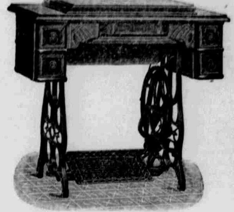
DROP HEAD CABINET ČÍS. 4

Jelikož pečujeme vždy o to, aby našim čtenářům a odběratelům dostalo se vždy to nejlepší a nejnovější, proto a potěšením sdělujeme, že jsme učinili opatření takové, abychom mohli šicí stroje tohoto druhu našim odběratelům poskytovat a sice za cenu až dšasné nízkou, vzhledem ku obyčejné ceně krámkové. Drop head cabinet stroje prodávány jsou jednotlivě za $45 hovář aneb za $75 na splátku. My obstaráme našim předplatitelům "drop head cabinet" stroj Pokrok Zapadu, se zaručením úplné spokojenosti a vrácením peněz do třiceti dnů, když by se nelíbil, jak následuje: