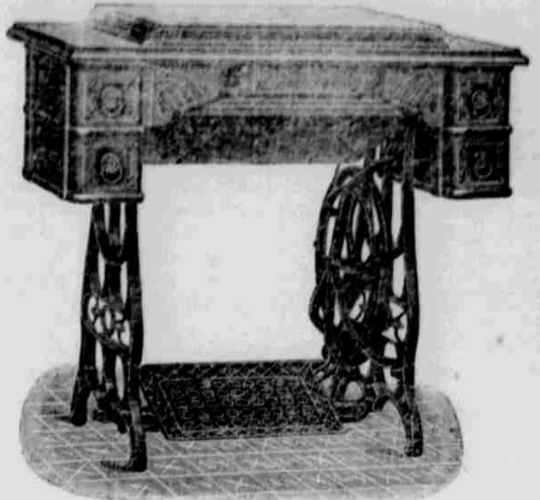
DROP HEAD CABINET ČÍS. 4.

Jelikož pečujeme vždy o to, aby našim čtenářům a odběratelům dostalo se vždy to nejlepší a nejnovější, proto a potěšením sdělujeme, že jsme učinili opatření takové, abychom mohli šicí stroje tohoto druhu našim odběratelům poskytovat i sice za cenu až úžasné nízkou, vzhledem ku obvyklé ceně krámské.