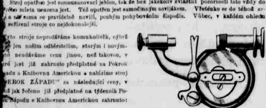
Šicí stroje jsou vyrobeny v naší továrně v Chicago, Illinois, a jsou velmi spolehlivé a trvanlivé. Jsou také velmi krásné a elegantní. Jsou dostupné v různých velikostech a cenách, takže můžete najít ten, který vám bude nejlépe vyhovovat. Pokud máte jakýkoli dotaz, obraťte se na náš oddělení prodeje. Budeme rádi vám pomoci vybrat ten nejlepší stroj pro vaše potřeby.